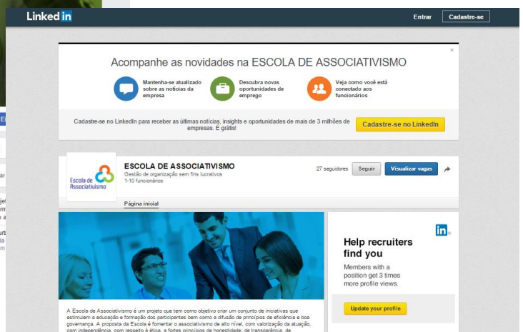
Página Facebook e LinkedIn: Escola de Associativismo