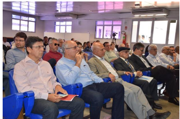
2º Encontro de Associativismo na Saúde em Cachoeiro de Itapemirim