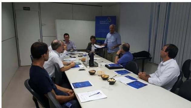
Reunião Sincafé - Pilula do Associativismo