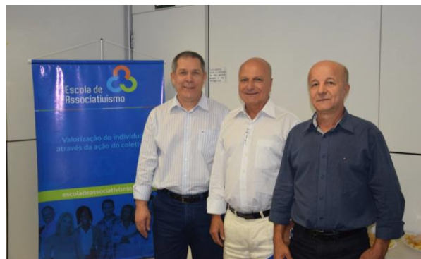
Reunião Sindifrios - Pilula do Associativismo