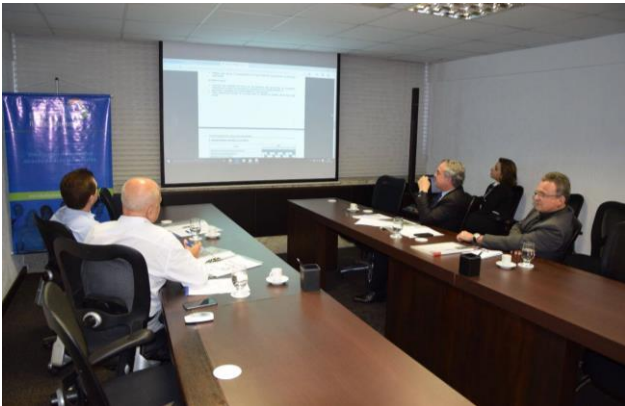
Reunião do Comitê Gestor