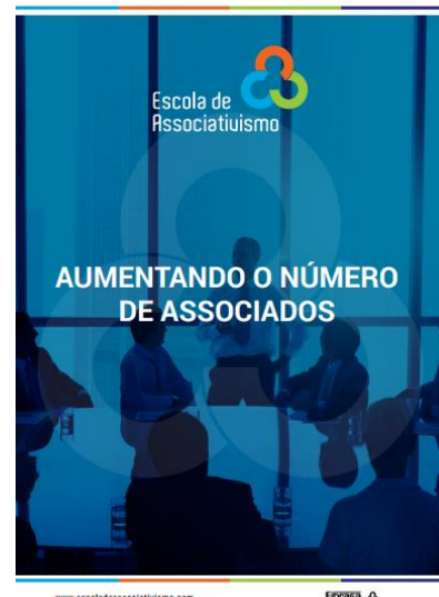
Cartilhas dos módulos 02: A Importância da Renovação no Associativismo, módulo 03: Inovação no Associativismo e módulo 04: Aumentando o Número de Associados

Iniciada a produção do módulo didático 05: Desenvolvendo Mercados por Meio das Associações e planejamento dos próximos módulos de 2017: Sustentabilidade de Associações, Transparência Total nas Associações, Governança das Associações e Eleições nas Associações.