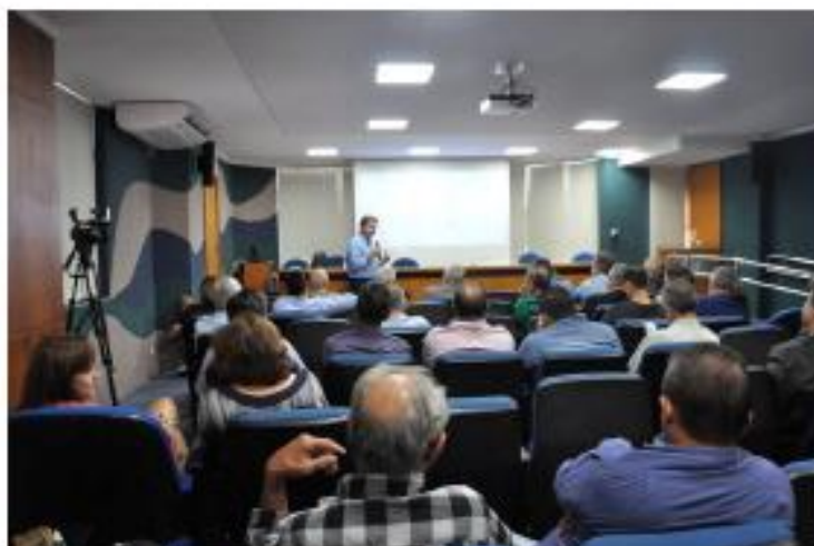
Cartilha e Lançamento Módulo 9: Comunicar é Preciso