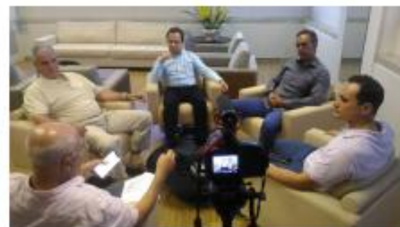
Gravações módulo 10