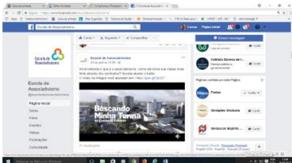
Divulgação do filme Buscando minha turma no Facebook