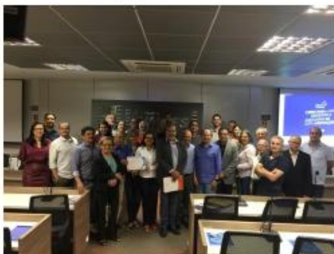
Curso: Formação de Dirigentes e Associados